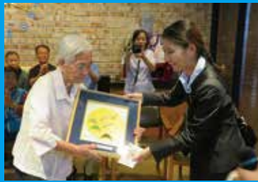
▲2017年9月 陝川(ハプチョン)原爆被害者福祉会館 訪問・贈呈