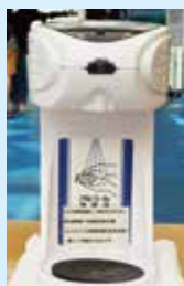
手指アルコール消毒器

この手指消毒器は、令和2年8月13日に 核兵器廃絶・平和建設国民会議 (KAKKINより原爆被害者支援事業の一環として寄贈されたものです)