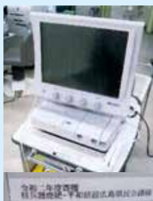
超音波計測・診断システム